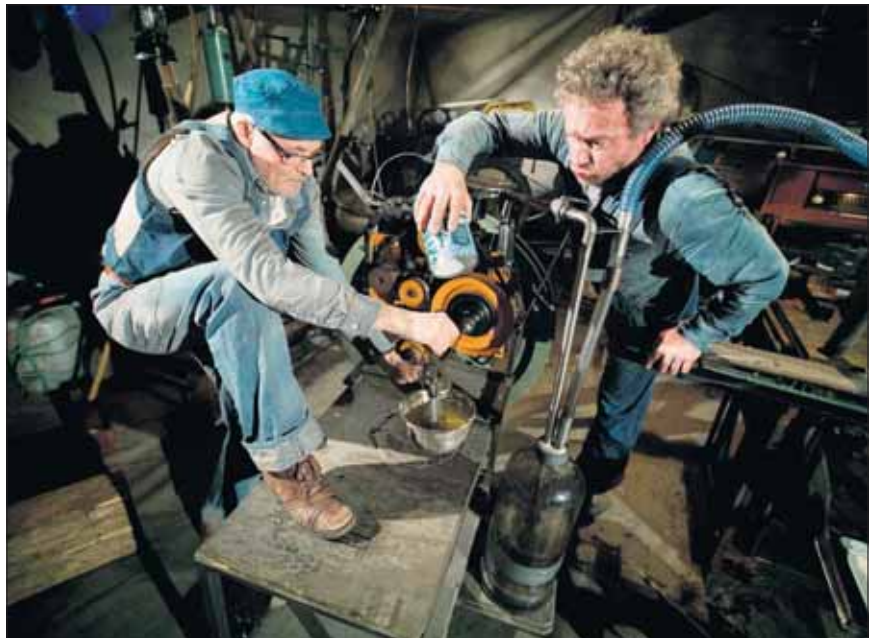
EGGERØYRE: Alt kan brukast, og her er det pisking av egg drive av ein forbrenningsmotor.